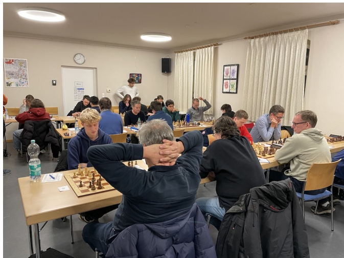
Münchener Mannschaftsmeisterschaft: RTA 1 – SG Aschheim/F./K. 1 und RTA 3 – SK Markt Schwaben